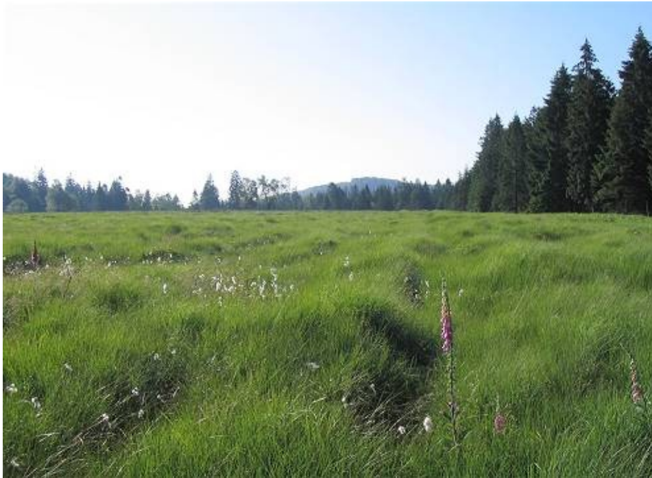
Abb. 5: NSG Bruch an der Eichkanzel: Starke Reliefunterschiede und heterogene Oberfläche als Folge der künstlichen Entwässerung des einstigen Niedermoores (auch erkennbar am unmittelbaren Nebeneinander von Wollgras und Fingerhut, ganz vorne rechts). Im Hintergrund: Gahrenberg.

Die einstmals einheitliche, großräumig homogene Oberfläche des Nieder- bis Übergangsmoores "Bruch an der Eichkanzel" hat sich durch alle diese Einwirkungen in eine sehr uneinheitliche, heterogene Oberfläche umgewandelt, deren Standorteigenschaften bereits auf sehr engem Raume einen starken Wechsel zeigen. Dies lässt sich nicht nur durch kleinmaßstäbliche Bodenkartierung nachweisen, sondern auch durch Beobachtung visuell leicht erkennbarer Merkmale. Abb. 5 zeigt beispielsweise eine engräumige Verzahnung von Wollgras-Flächen neben einem Fingerhut-Standort, wie dies ohne die nachhaltigen kleinräumigen Standorts-Veränderungen im Laufe der vergangenen 100-150 Jahre nicht erklärbar wäre.