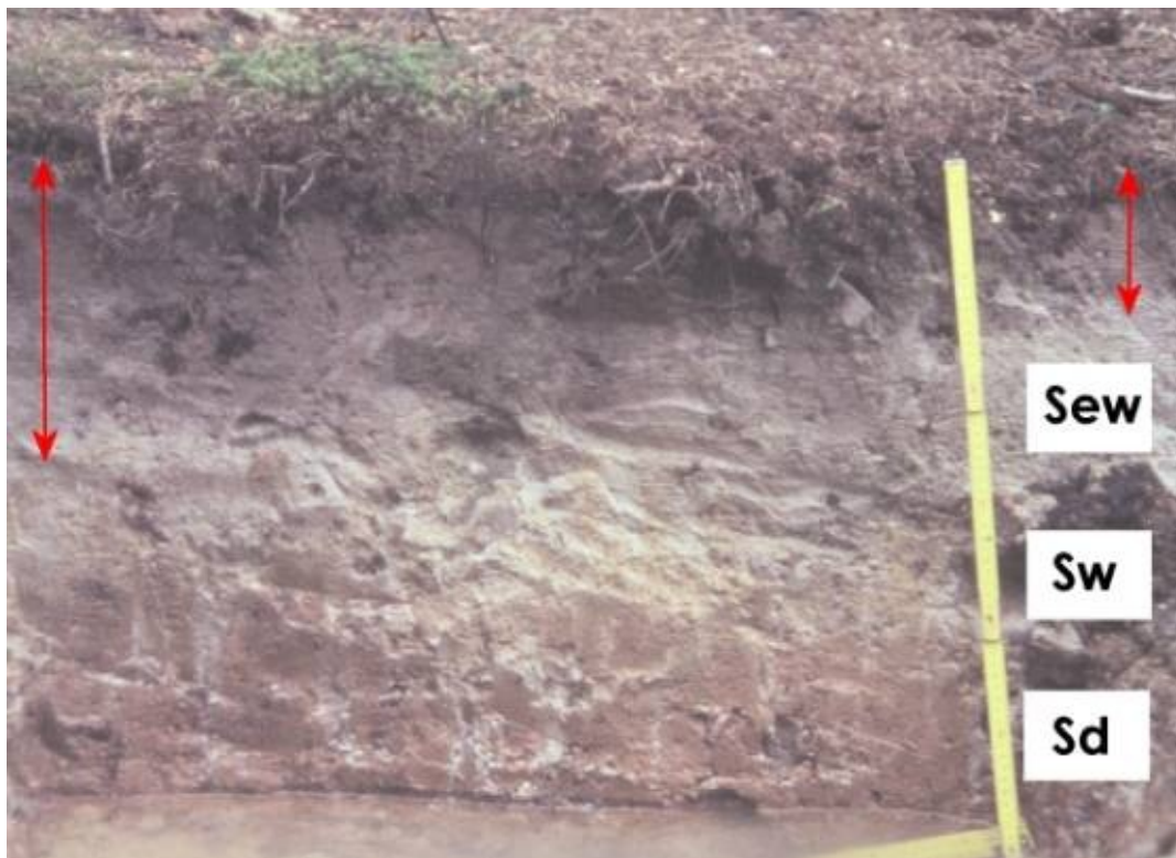
Abb. 3 Stagnogley (nahe Forstscheid an der Höhenstrasse im Reinhardswald). Unter dem Humus-Auflagehorizont tritt im nass-gebleichten Horizont (Sew) ein diffus grauer, schwach humoser Bereich (rote Pfeile) mit sehr unregelmäßiger Untergrenze auf, der auf Verwühlung durch Tiere hindeuten kann. Der dichte, wasserstauende Sd-Horizont beginnt in etwa 40 cm Tiefe (hier im Bild wassererfüllt)

Mäßig staunasse Böden (Pseudogleye) können noch landwirtschaftlich genutzt werden, während die Nutzung stark staunasser Böden, wie der Stagnogleye (Molkenböden), aufgrund ihrer Luftarmut, Versauerung und Nährstoffarmut meist nur forstlicher Art ist (heute z.B. Fichten, bei geringer Wachstumsleistung). Eine (im übrigen Deutschland kaum anzutreffende) Art forstlicher Entwässerung tritt in Form der für den Reinhardswald spezifischen Entwässerungshügel ("Klumpse") auf, die um etwa 1850-60 während der damaligen Aufforstungen angelegt wurden. Sie werden bei forstlichen Exkursionen häufig demonstriert.