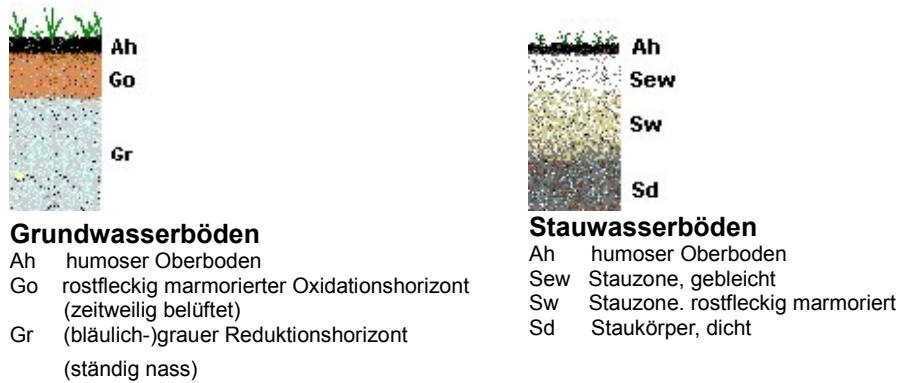
Abb. 2 Unterschiede im Profilaufbau von Grundwasserböden und Stauwasserböden

(c) Besonders extreme Stauwasserböden können auf hochgelegenen Verebnungen der kühleren, niederschlagsreicheren Mittelgebirge auftreten. Dort können unter stauenden Bedingungen sehr lange (bis zu 10 Monate) Nassphasen und sehr kurze Trockenphasen auftreten. Solche Böden besitzen, unterhalb einer schmierigen Auflage von Feuchtrohhumus, in der Stauzone meist eine nässebedingte, extrem starke Bleichung. Solche extremen Stauwasserböden werden Stagnogleye , volkstümlich auch Molkenböden , genannt (nach ihrer milchig-weißen Farbe, die meist auch interessierten Laien deutlich auffällt). Im Schwarzwald sind sie als “Missenböden“ bekannt.